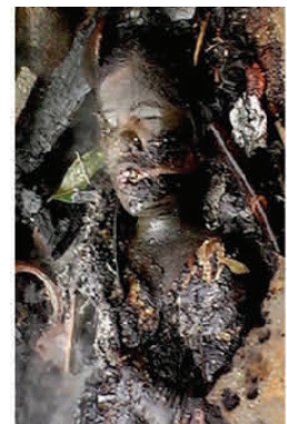
LA PERSECUCION EN ORISSA EN LA INDIA

12 Ahora vemos por espejo, oscuramente; mas entonces veremos cara a cara. Ahora conozco en parte; pero entonces conoceré como fui conocido.