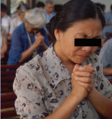
Mujer de la iglesia subterránea de China en constante oración por sus hermanos perseguidos.

43 veces se menciona la palabra amor en 1ª. De Juan